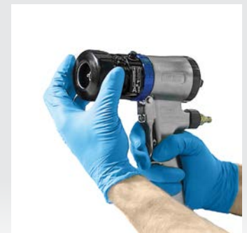
Luftkappe und Haltering installieren.