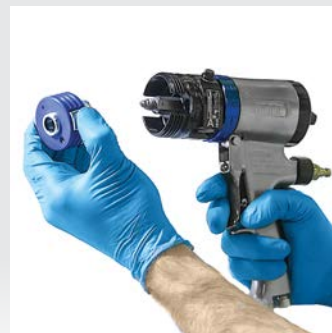
Drücken Sie die neue PC Materialpatrone auf die Mischkammer